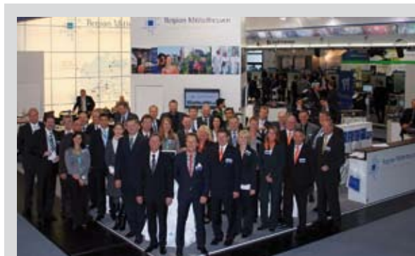
Mittelhessen auf der Expo Real: Seit 2005 ist MitteHessen mit einem Gemeinschaftsstand auf der wichtigsten Immobilienmesse Europas vertreten.