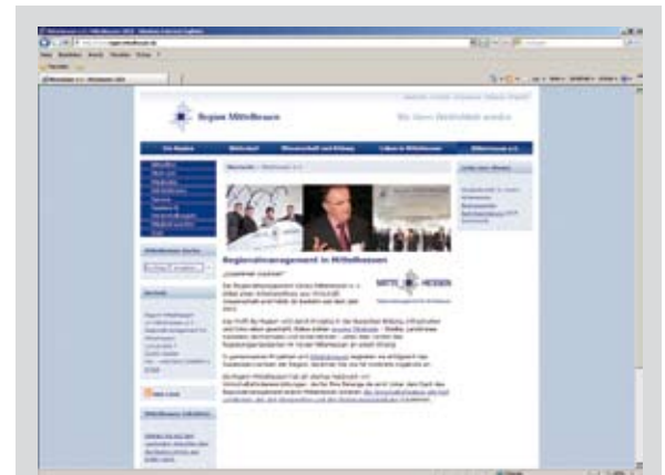
MitteHessen ist auch im Internet vertreten. Unter www.mittehessen.de finden Besucher alle Fakten zum Verein und der Region Mittelhessen.

Inzwischen 90 Mitglieder und 160 ehrenamtliche Experten in derzeit neun Arbeitskreisen sorgen dafür, dass Ideen in Mittelhessen Wirklichkeit werden. Der Verein wirbt erfolgreich Fördermittel für die Region ein oder ist dabei behilflich. Wir führen Betroffene zusammen und schaffen Lösungen zum Wohle der gesamten Region.